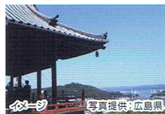
イメージ

本尊の千手観世音菩薩は、聖徳太子作と伝えられる秘仏です。断崖絶壁に建つ朱塗り唐づくりの鐘楼は、志賀直哉、林芙美子らの作品にも登場しています。日本の音風景100選に選定されています。