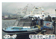
イメージ

海上自衛隊の潜水艦や護衛艦など盛りだくさん。大迫力の艦船を間近に眺めながらのクルージングは呉ならではの魅力です。