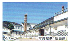
イメージ

西条駅前の東西に延びる、旧山陽道沿い約800mの通り。白壁やなまこ壁の酒蔵と赤レンガの煙突が織りなす景観が美しい。