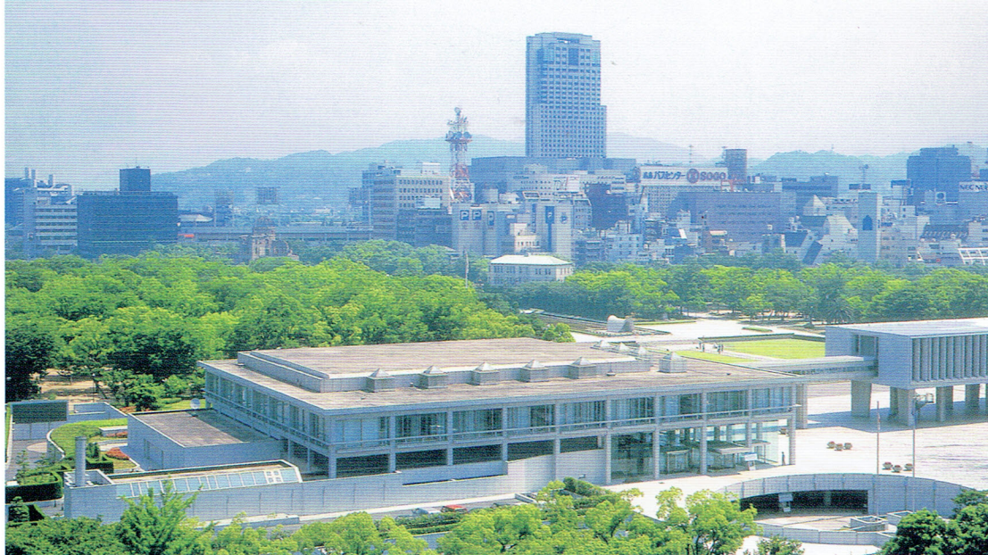
広島国際会議場 とリーガロイヤルホテル広島