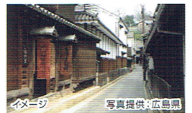
イメージ

鞆の浦は、古くから「潮待ちの港」として栄えたところで、古い土壁のつづく路地や情緒ある家並、昔の土蔵などがそのまま残っています。幕末には当時、坂本龍馬が隠れ潜んだ部屋も公開されています。